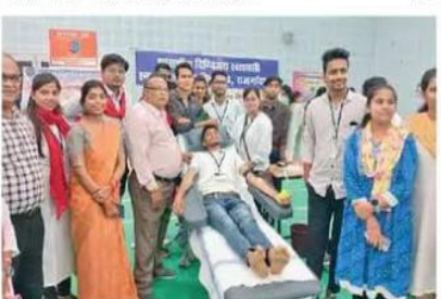
कॉलेज के छात्र-छात्राओं ने रक्तदान में लिया बढ़-चढ़कर हिस्सा।