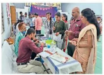
राजनांदगांव. पंजीयन कराने बड़ी संख्या में उपस्थित रही।