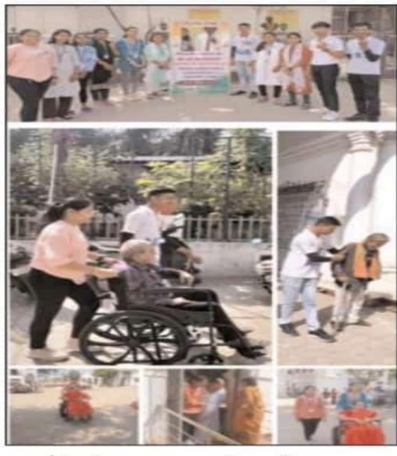
कार्यों की सराहना की गयी।

छत्तीसगढ़ विधानसभा चुनाव 2023 के प्रथम चरण मतदान में राष्ट्रीय सेवा योजना इकाई 1 व 2 शासकीय दिग्विजय महाविद्यालय राजनांदगांव के